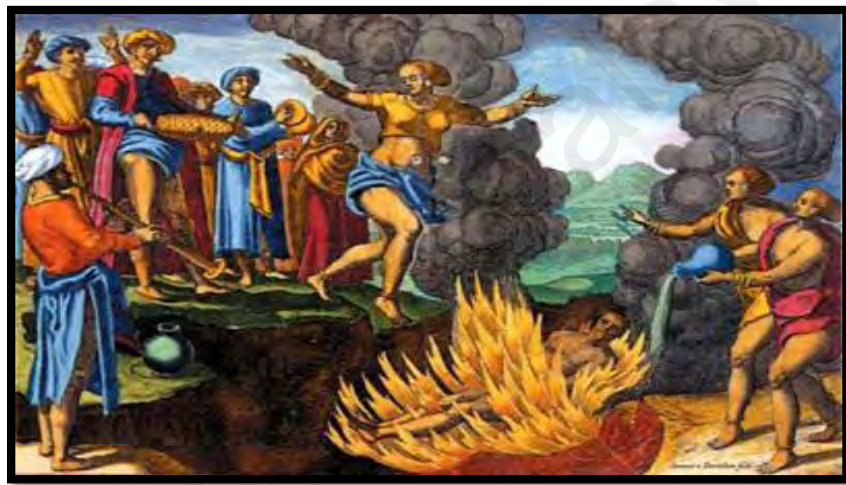
Rajah 1.1 Tradisi bakar diri iaitu “Sati”

Penerimaan ataupun pengasingan terhadap wanita terlihat dalam kehidupan sosial masyarakat wanita yang sering menjadi mangsa diskriminasi dan juga penghinaan. Senario yang menggambarkan kesulitan yang dihadapi oleh wanita dapat dilihat dalam perkahwinan kanak-kanak perempuan, pemberian dowri dan larangan terhadap perkahwinan semula balu menyebabkan kemunculan balu- balu muda. Prasangka dan diskriminasi terhadap balu begitu negatif sehingga mereka dipaksa untuk melakukan sati (membakar diri) bersama mayat suami mereka daripada hidup sebagai seorang balu (Bang Seru,2012,p.2).