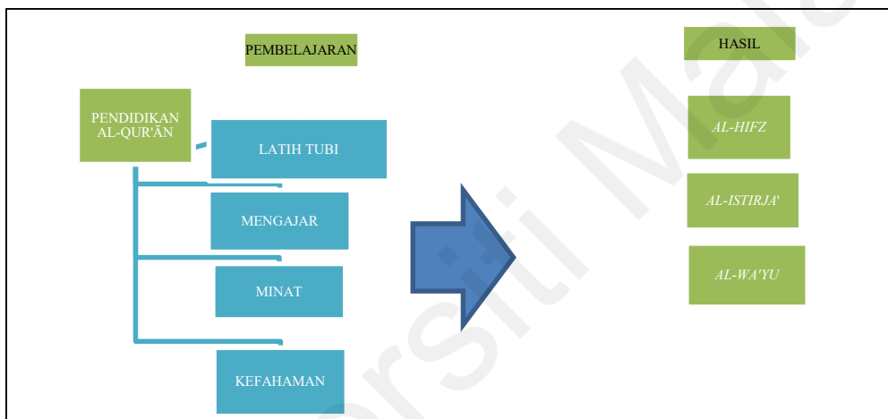
Rajah 1.2 : Kerangka Teori Pendidikan Al-Qur’ān Al-Qab s