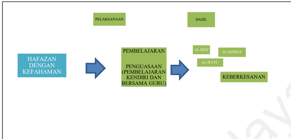
Rajah 1.3 : Kerangka Konseptual