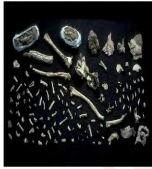
شكل رقم 3. 1: حفريات مفتتة

والمنطق وإلى رفض كل ما لا يمكن إثباته علمياً وتركيز المجتمع على الدنيا والإنسان 1 ، أي اهتمام بالماديات المحسوسة التي تعود على المجتمع بالنفع والفائدة، بغض النظر عن المبادئ والأخلاق التي يجب المحافظة عليها. وينقد الملحد نفسه بالأفكار التي يتبناها فهو يخضع الدين للتجارب العلمية إلا أنه يعتمد على خصائص ومعطيات غير واقعية، فهم يطوعون المعطيات على حسب رغباتهم وميولهم ليثبتوا صدق أفكارهم، وهذا ما أكده العلال بقوله: "إنّ التطوريين وجدوا حفريات مفككة وعظامها مفتتة لا توحى بصورتها الأصلية، فجمعوها وركبوها واختلقوا لها صورة تطورية زائفة كحلقة وسيطة بين القرد والإنسان على حسب أهوائهم، وأطلقوا عليها اسم أوردي، كما في الأشكال الآتية" 2 :