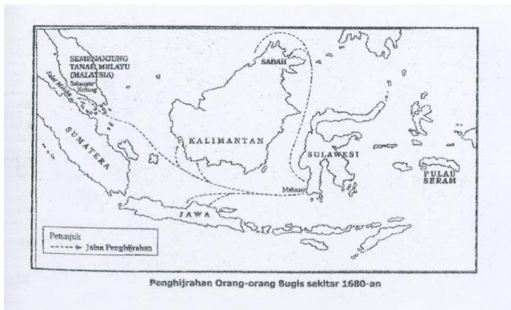
Peta 1 : Tamrin (2001:16)