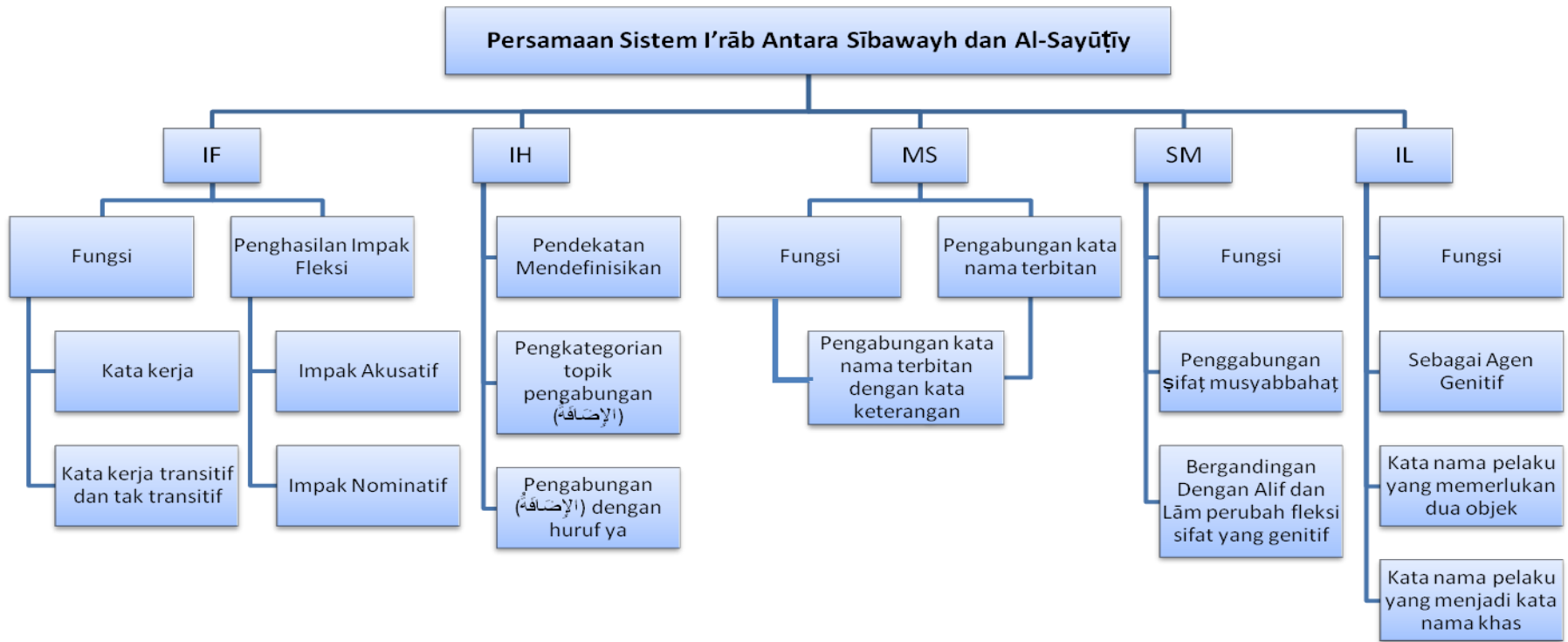
Rajah 5.1: Persamaan sistem i'rāb (الإعراب) antara Sībawayh dan al-Sayūṭīy.