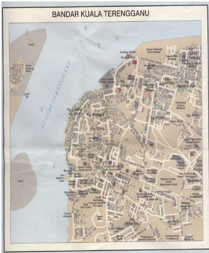
Peta 1.2 : Peta Bandar Kuala Terengganu