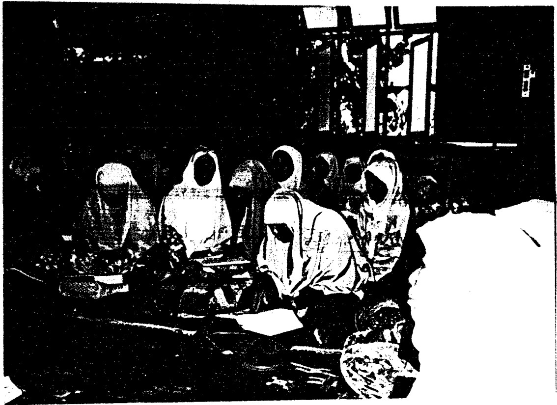
Para pelajar yang terdiri dari pendengar dan penadah kitab sedang mengikuti pembelajaran di kelas fardhu c ain wanita (Sukarela)