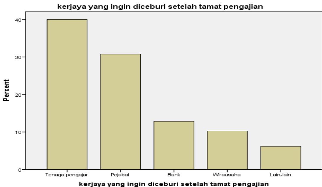
Rajah 4.2.8 Kerjaya yang Ingin Diceburi Setelah Tamat Pengajian

Adapun kerjaya yang ingin diceburi oleh pelajar setelah tamat pengajian adalah seramai 78 responden (40.0%) memilih ingin menjadi guru dan sejenisnya iaitu menyumbang ilmu yang ada kepada masyarakat, 60 responden (30.8%) memilih bekerja di pejabat, 25 responden (12.8%) memilih bekerja di bank, dan 20 responden (10.3%) memilih berniaga. Namun demikian terdapat 12 responden (6,2%) yang belum memikirkan kerjaya apa yang ingin diceburi selepas tamat pengajian. Itu dapat dilihat dari rajah berikut.