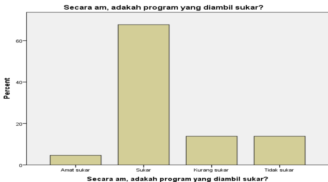
Rajah 4.3.5 Pandangan Pelajar Terhadap Program yang Telah Diambil