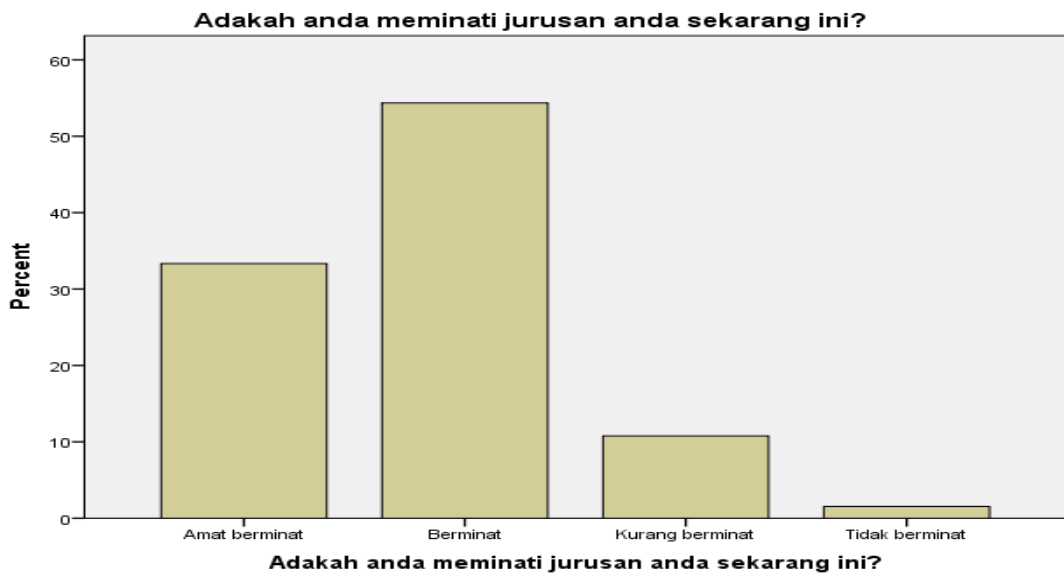
Rajah 4.3.3 Minat kepada Jurusan yang Telah Diambil