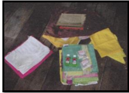
Gambar 11: Langkapan masyarakat Bajau Kubang (kiri) dan langkapan Bajau Laut (kanan)