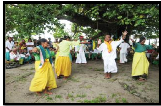
Gambar 12: Upacara berzanji selepas upacara magombbo (kiri) yang dilakukan oleh komuniti Bajau di Sitangkai Filipina. Upacara ini sama dengan upacara yang dilakukan oleh komuniti Bajau di Malaysia. Manakala gambar (kanan) merupakan tarian Igal di Sitangkai yang bertujuan menyajikan tarian kepada roh nenek moyang.

Sumber: Kajian lapangan Dr. Hanafi Hussin pada tahun 2005. Sumber boleh dilihat dalam “Diaspora Bajau Laut dan Pengekalan Serta Penerusan Amalan Tradisi di Sabah” Borneo Research Journal , Volume 2, 2008.