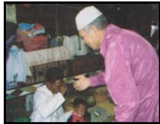
Gambar 8: Bacaan doa dan zikir (jinikilan) yang dilakukan oleh komuniti Bajau Laut di Kampung Bangau-Bangau Semporna sepanjang upacara Magpiai-Bahau