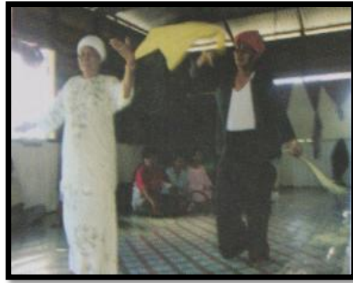
Gambar 9: Persembahan Magtagunggu' yang dimainkan dengan alatan muzik kulintangan (kiri) manakala gambar (kanan) merupakan tarian Igal-Jin yang bertujuan menyajikan tarian kepada roh nenek moyang.

Sumber: Kajian lapangan Dr. Hanafi Hussin pada tahun 2005 di daerah Semporna. Sumber boleh dilihat dalam bukunya “Magpiai-Bahau: Reunion Between Living and Dead among Bajau Community of Semporna” dalam Southeast Asian Religion, Culture and Art of the Sea .