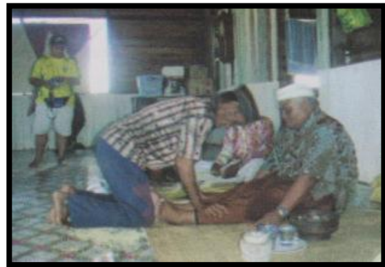
Gambar 10: Proses penyembuhan akibat terkena penyakit tulah kebusungan (sumpahan roh nenek moyang) yang dilakukan oleh kelamat kepada pesakit.