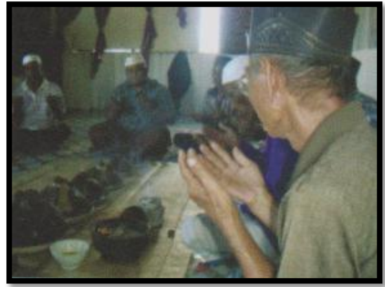
Gambar 7: Bacaan doa dan zikir (jinikilan) yang dilakukan oleh komuniti Bajau Kubang sepanjang upacara Magpiai-Bahau