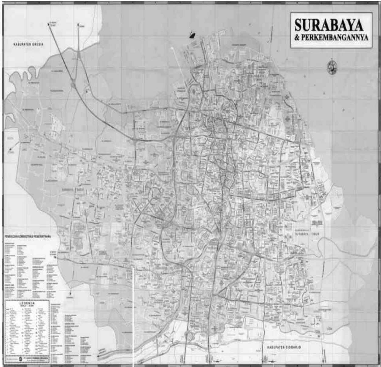
Peta bandar Surabaya dan kelurahan Alun-alun contong (yang bertanda)