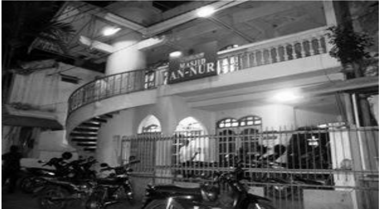
Masjid dan markas Ahmadiyah cawangan Jawa Timur di kelurahan Alun-alun contong