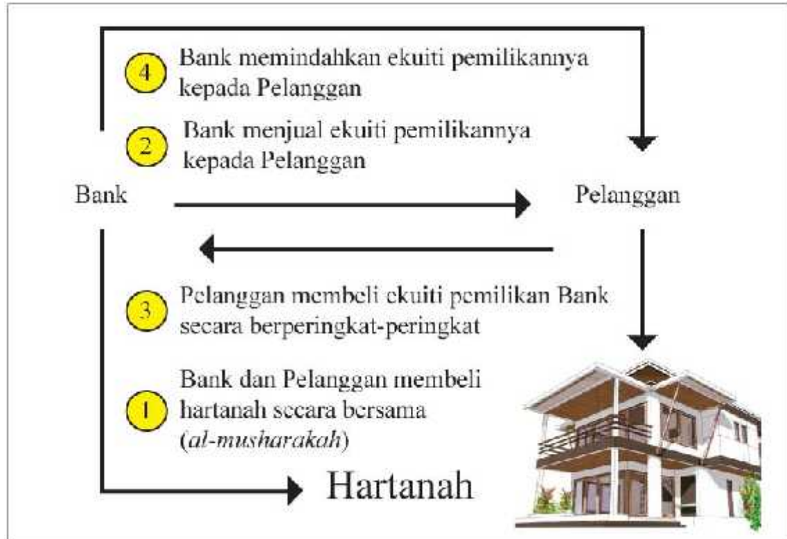
Jadual 2.2 Gambaran Asas Musharakah Mutanaqisah

Bentuk keempat ialah pelanggan memiliki sebuah projek sedia ada dan menghadapi masalah kekurangan modal untuk meneruskan projek tersebut. Pelanggan mengemukakan permasalahan tersebut kepada bank dan bank bersetuju untuk menjadi rakan kongsi pelanggan dengan menyediakan peralatan atau keperluan yang dikehendaki. Bank memperolehi keuntungan daripada bahagiannya dan sebahagian yang lain bagi menampung jumlah pembiayaan bank ke atas projek. Kedua-dua pihak bersetuju bahawa bank menjual bahagiannya kepada pelanggan dengan sekali pembayaran atau beberapa kali pembayaran sehinggalah pelanggan memiliki