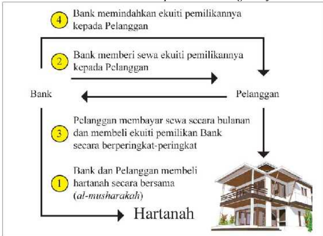
Jadual 2.3 Gambaran Musharakah Mutanaqisah Bersama Dengan al-Ijarah

Bentuk ketujuh ialah bank bersekutu dengan bank lain dalam mengeluarkan pembiayaan terhadap suatu projek di mana satu persetujuan awal dicapai iaitu salah satu bank (bank-bank) menarik diri demi kepentingan rakan kongsi (rakan-rakan kongsi) yang lain dan keuntungan dibahagikan mengikut persetujuan yang disepakati bersama. Musharakah ini dinamakan sebagai musharakah mutanaqisah dengan pembiayaan bank terhadap institusi-institusi bersekutu. 228