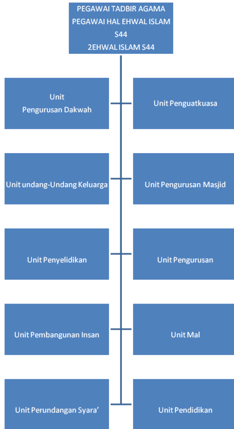
Jadual 3.1 : Carta Organisasi Kedudukan Unit-Unit Pejabat Agama Islam Daerah Klang