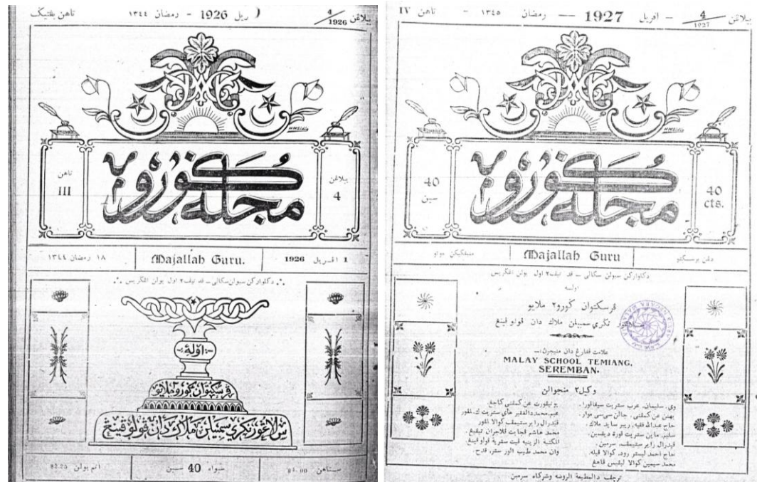
Muka hadapan pada tahun 1926

Lihat Gambar 3. 4: Muka Hadapan Majalah Guru di bawah: