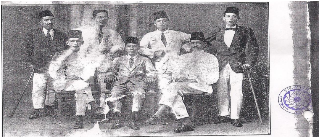
Gambar 3.1: Sidang Redaksi Majalah Guru (Bilangan 5, tahun yang kedua, Mei 1925)