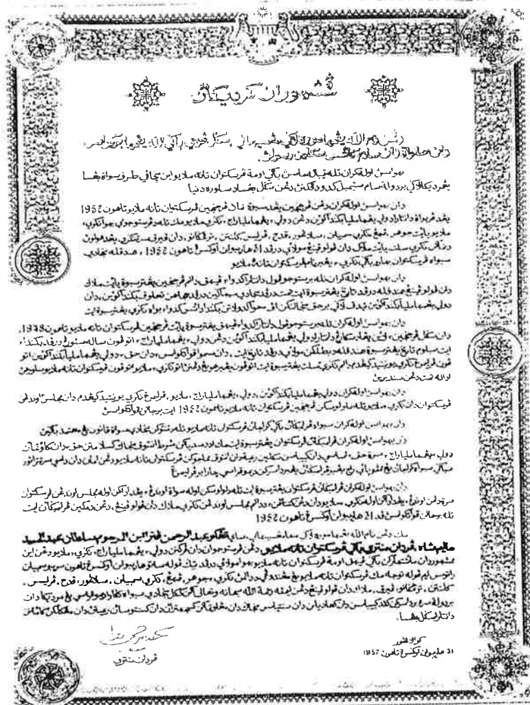
Permasyhuran Kemerdekaan, 31 Ogos 1957

"Permasyhuran Kemerdekaan" adalah Pengisytiharan Kemerdekaan yang dibuat oleh Y.T.M. Tunku Abdul Rahman Putra, di mana semua negeri-negeri Melayu termasuklah Melaka dan Pulau Pinang kekal menjadi sebuah negara yang berdaulat dan Merdeka dan patuh kepada prinsip-prinsip demokrasi. Pengisytiharan ini merupakan ekoran Perjanjian Persetujuan Tanah Melayu yang dibuat oleh Baginda Queen Elizabeth II dengan Duli-Duli Yang Maha Mulia Raja-Raja Melayu pada tahun 1957. Dengan Perjanjian ini pada 31 Ogos.