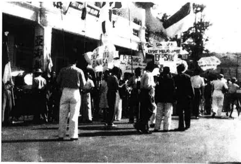
Kongres PKMM di Melaka pada 25/12/1946