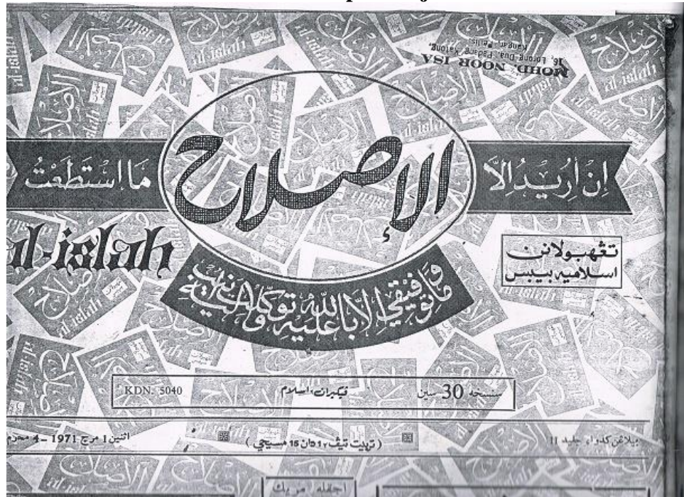
Gambar 3.9: Kulit Depan Majalah al-Islah