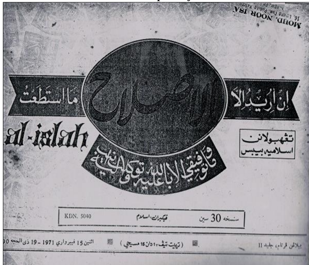
Gambar 3.2: kulit depan Majalah al-Islah