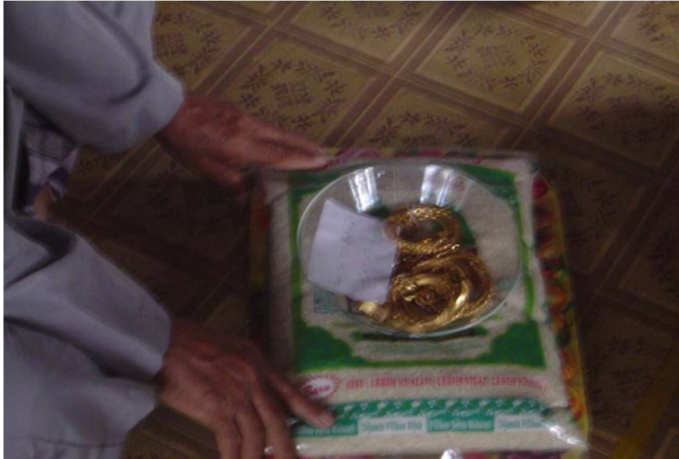
Gambar 1 : Bahan-bahan yang digunakan untuk upacara pembayaran fidyah iaitu sekampit beras dan beberapa utas barang-barang kemas. Foto diambil semasa upacara membayar fidyah di rumah En. Yusuf bin Sohor pada 16 Jun 2007.