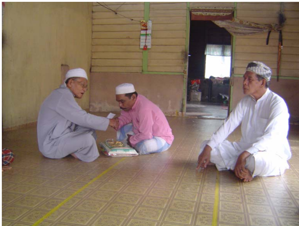
Gambar 2 : Waris simati menyerahkan kepada pengendali upacara fidyah untuk mengendalikan upacara pembayaran fidyah bagi simati.