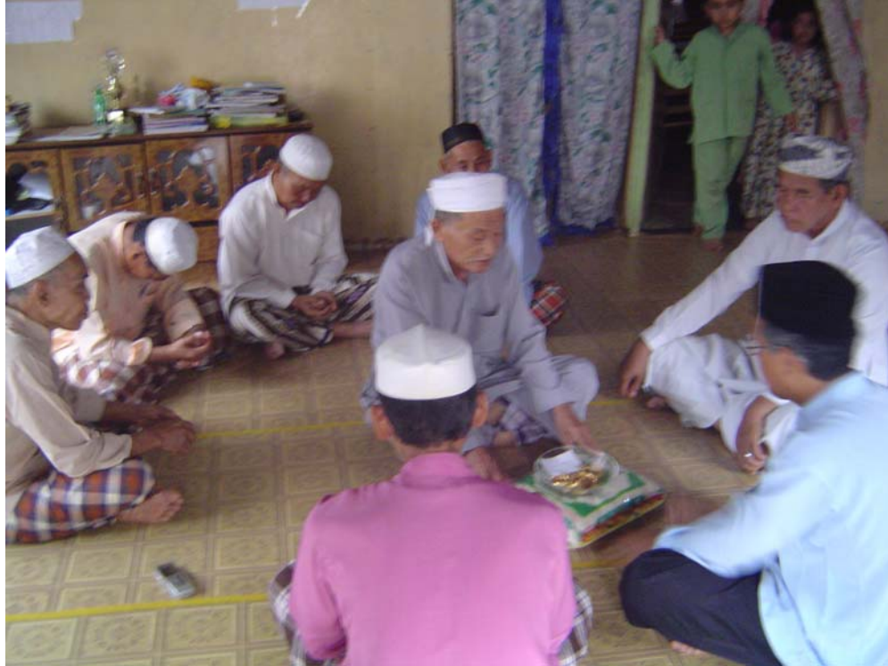
Gambar 3 : Pengendali upacara fidyah sedang menjalankan upacara pembayaran fidyah secara sorong tarik dengan salah seorang peserta jemputan khas