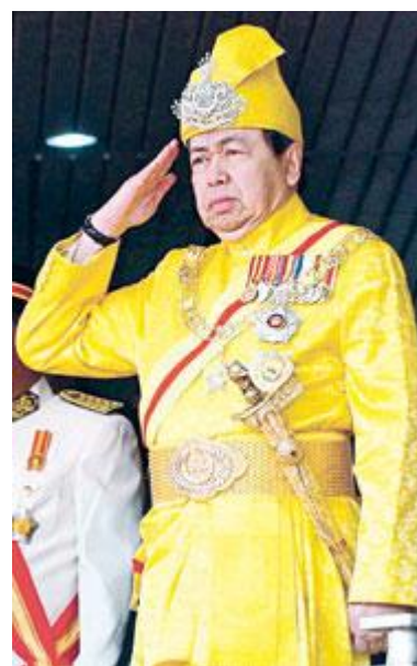
Sultan Sharafuddin Idris Shah

"Cuba kita baca sejarah yang ditulis oleh orang Inggeris yang mana ada tertulis 'Tanah Melayu', 'Negeri-negeri Melayu Bersekutu' dan juga ada menyebut 'Raja-raja Melayu'.