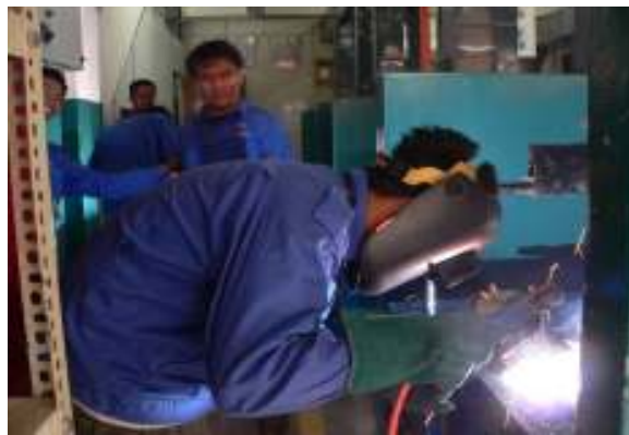
Kelas amali dalam bengkel kimpalan pelajar Jabatan Kejuruteraan Mekanikal.