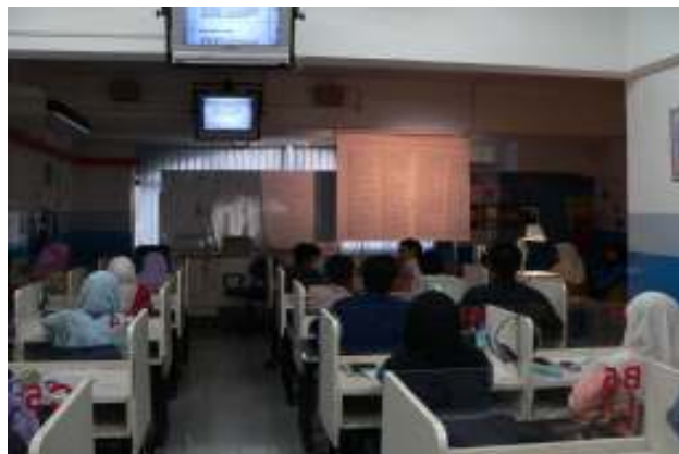
Suasana sesi pengajaran dan pembelajaran di makmal bahasa.