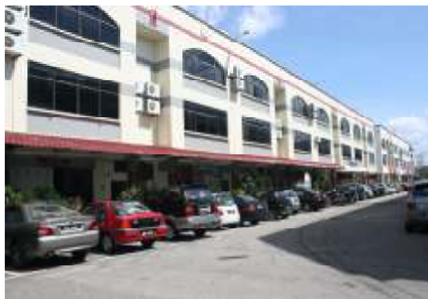
Bahagian luar bilik kuliah Politeknik Kota Melaka.