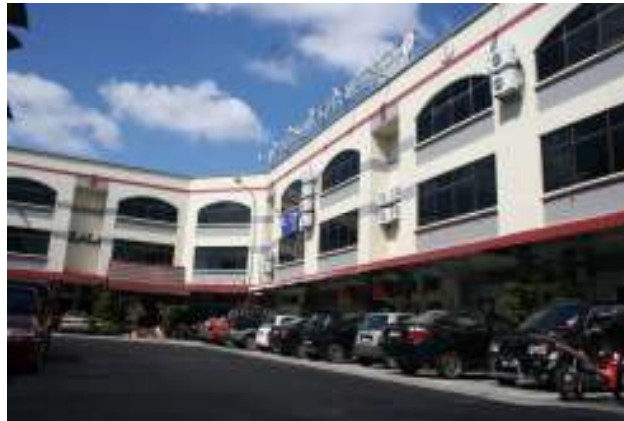
Kawasan kaki lima bangunan Politeknik Kota Melaka yang terdiri daripada beberapa unit rumah kedai.