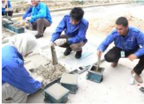
Kelas amali bancuhan simen pelajar Jabatan Kejuruteraan Awam.