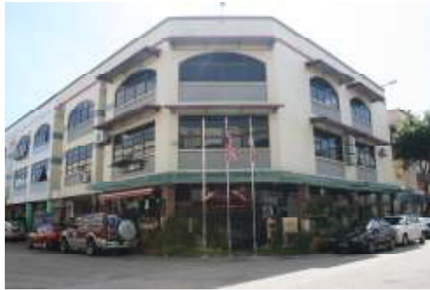
Blok pejabat pentadbiran Politeknik Kota Melaka.