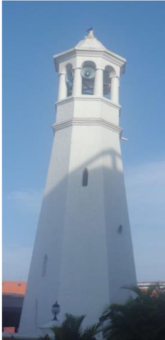
Lampiran N: Ruang solat Masjid Kampung Hulu