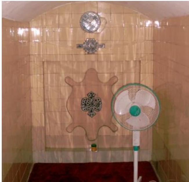
Lampiran D: Masjid Kampung Keling