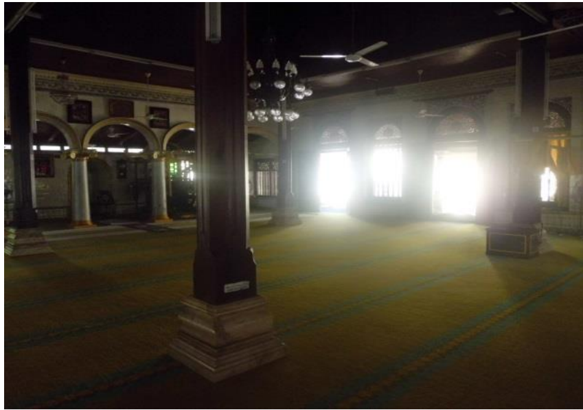
Lampiran F: Menara Masjid Kampung Keling