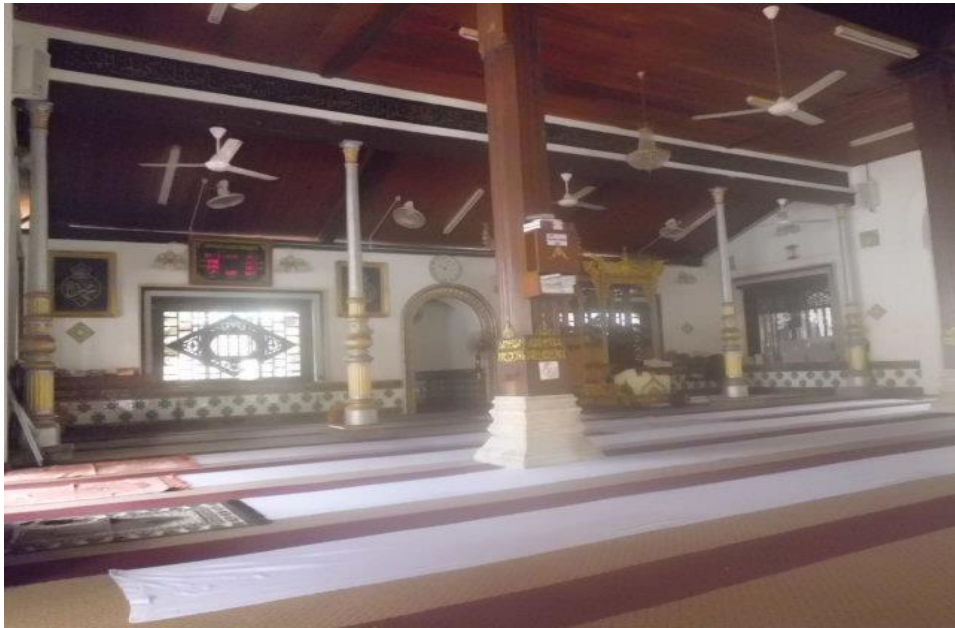
Lampiran J: Masjid Kampung Hulu