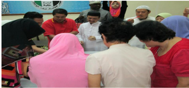
Gambar 4.9: Sambutan Tahun Baru Cina yang dianjurkan juga oleh MAIDAM Terengganu turut disertai oleh masyarakat Cina bukan Muslim bersama-sama meraikan yee sang .