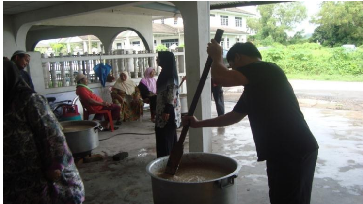
Gambar 4:14: Saudara Baru Cina sedang mengacau bubur Asyura di perkarangan Kompleks Darul Fitrah.