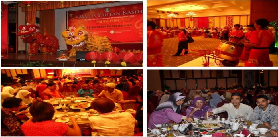
Gambar 4.6: Persembahan tarian singa dan paluan gendang serta komuniti Melayu Muslim merasai hidangan Cina dengan mencuba menggunakan chop stick .