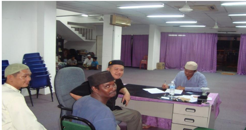
Gambar 4.4: Pengalaman merasai tinggal bersama dengan Saudara Baru yang tinggal di Kompleks Darul Fitrah di Kampung Bukit Besar Kuala Terengganu.