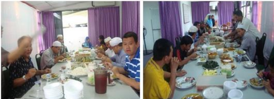
Gambar 4:12: Saudara Baru Cina Bersama-sama Menikmati Jamuan Hari Raya Idil Fitri Dengan Masyarakat Muslim Yang Lain.

Melalui pengalaman turut serta, penulis telah mengikuti program sambutan hari kebesaran Islam yang dianjurkan oleh badan-badan dakwah negeri Terengganu. Pada 16 September 2012, persatuan Darul Fitrah telah melaksanakan sambutan Hari Raya Idil Fitri bertempat di pusat aktivitinya di Kampung Bukit Besar. Para peserta terdiri daripada masyarakat Melayu Muslim, Cina dan etnik lain yang telah memeluk agama Islam. Komuniti Muslim dari pelbagai bangsa berkongsi menyediakan sajian makanan. Selain daripada itu, masyarakat Muslim bersalam-salaman, duduk bersama-sama dan menikmati hidangan yang disediakan.