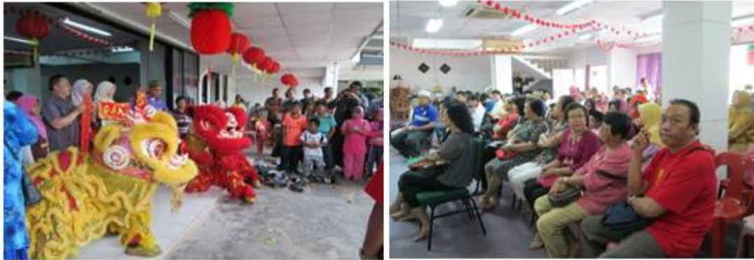
Gambar 4.8: Persembahan Tarian Singa yang sempena Sambutan Tahun Baru Cina di perkarangan pusat aktiviti MACMA Terengganu