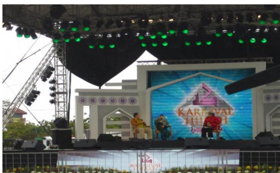
Gambar 4.5: Karnival TV Al-Hjirah di Terengganu 137

Cina Muslim dan masyarakat bukan Muslim disajikan dengan persembahan tarian tradisional Cina. 136 Dalam konteks ini, dialog perkongsian pengalaman kehidupan beragama ditonjolkan dalam bentuk lebih formal. Walaupun berbeza agama, didapati wujud ruang perkongsian dalam membicarakan soal-soal rutin kehidupan biasa seperti dalam pendidikan anak-anak. Sama ada dalam ajaran Islam atau pun ajaran Buddha galakan mencari ilmu, mengamalkan akhlak yang baik dan berbuat baik kepada ibu bapa merupakan amalan yang dititik beratkan.