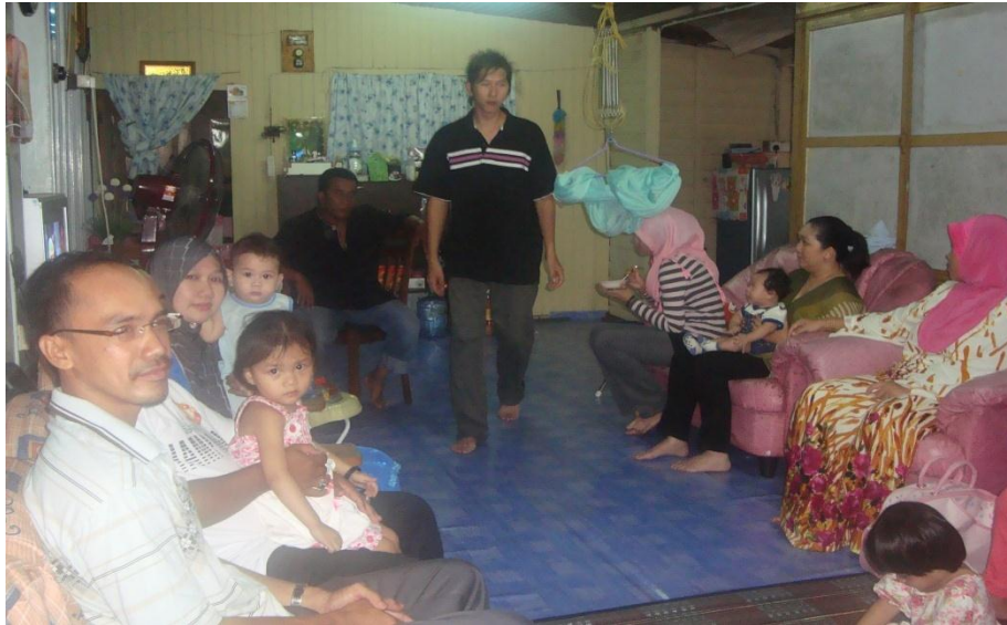
Gambar 4.2: Kunjungan pengkaji ke rumah Saudara Baru Cina di Kampung Pulau Kambing, Kuala Terengganu semasa majlis rumah terbuka sempena Hari Raya Idul Fitri.