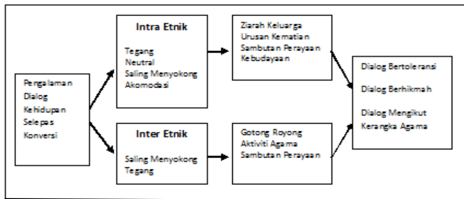
Rajah 6.2 : Pengalaman Dialog Kehidupan Komuniti Cina Pasca Konversi

Sumber : Kajian Lapangan (Kajian Kualitatif & Soal selidik)