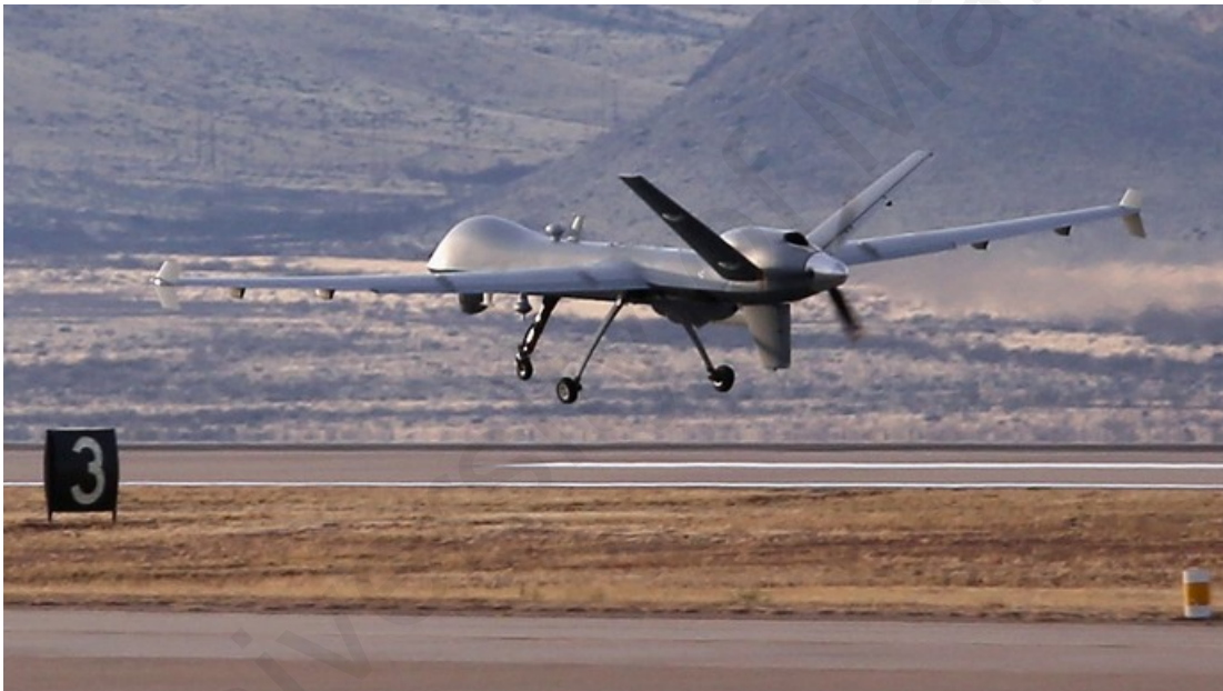
Drone strikes killing civilians in Yemen