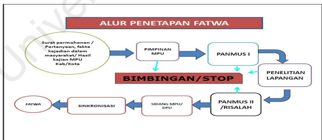
Rajah 5.1: Proses Penetapan Fatwa

Dalam mengeluarkan fatwa, dibuat sebuah alur proses yang jelas, di mana fatwa-fatwa yang akan dikeluarkan merupakan jawapan kepada pertanyaan masyarakat, fakta kejadian yang berlaku di tengah-tengah masyarakat ataupun hasil kajian MPU kabupaten/kota yang diajukan oleh masyarakat. Kemudian disampaikan kepada ketua, apabila dianggap cukup dengan hanya memberikan bimbingan maka alur fatwa berhenti sampai di sini. Jika memerlukan tindakan lebih lanjut maka akan disampaikan ke panitia musyawarah, selepas itu akan dilakukan kajian lapangan berkenaan isu yang berbangkit dan kemudian masuk kembali ke panitia musyawarah untuk dibuatkan risalah. Bila pada tahap ini dianggap kes boleh selesai maka tidak perlu dilanjutkan. Akan tetapi jika tidak juga selesai maka akan dilanjutkan dengan sidang MPU atau DPU kemudian ditelaah dan diterbitkan fatwa. Sila rujuk gambar rajah 86 berikut: