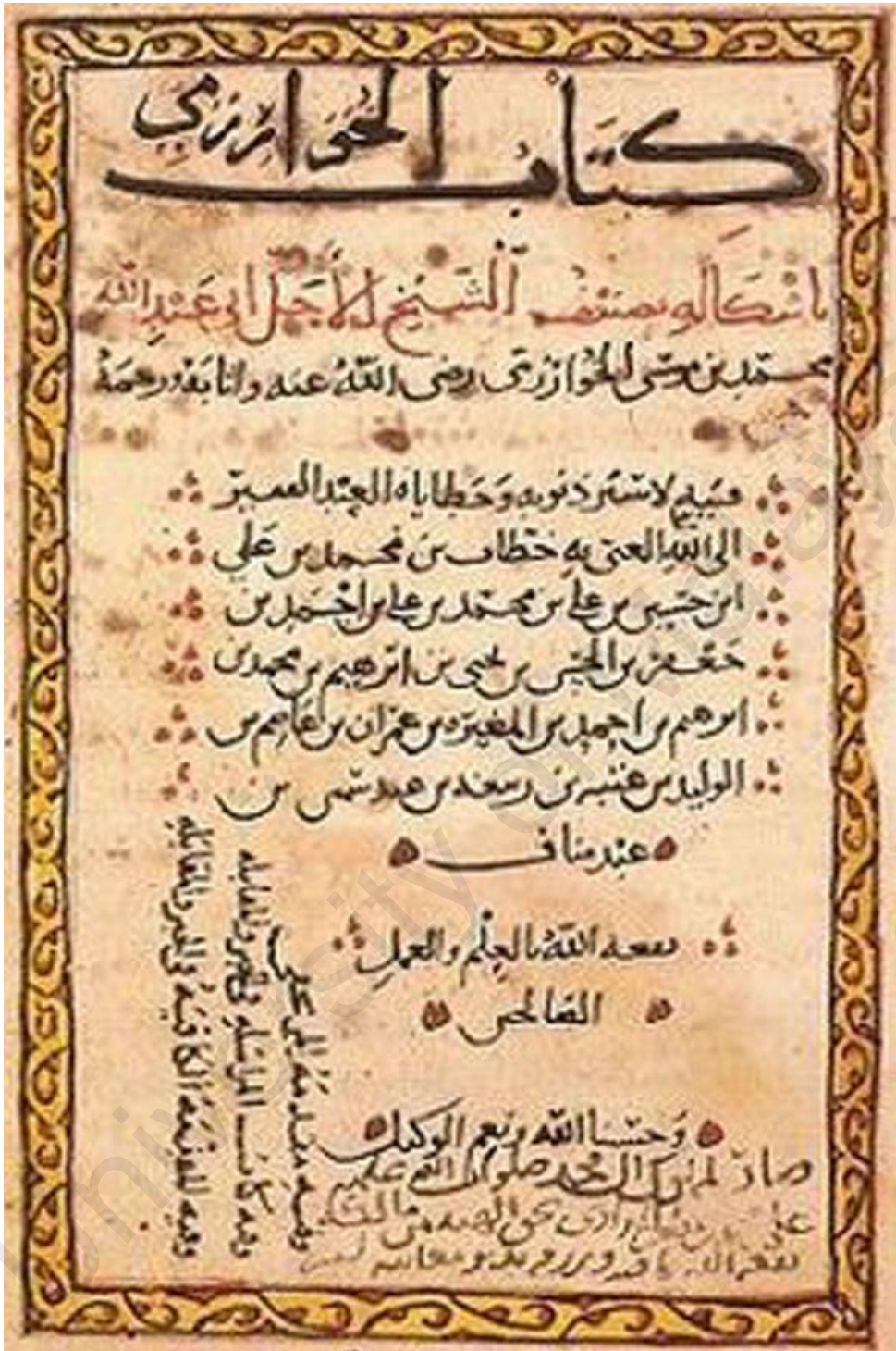
صورة من كتاب الخوارزمي في الجبر والمقابلة