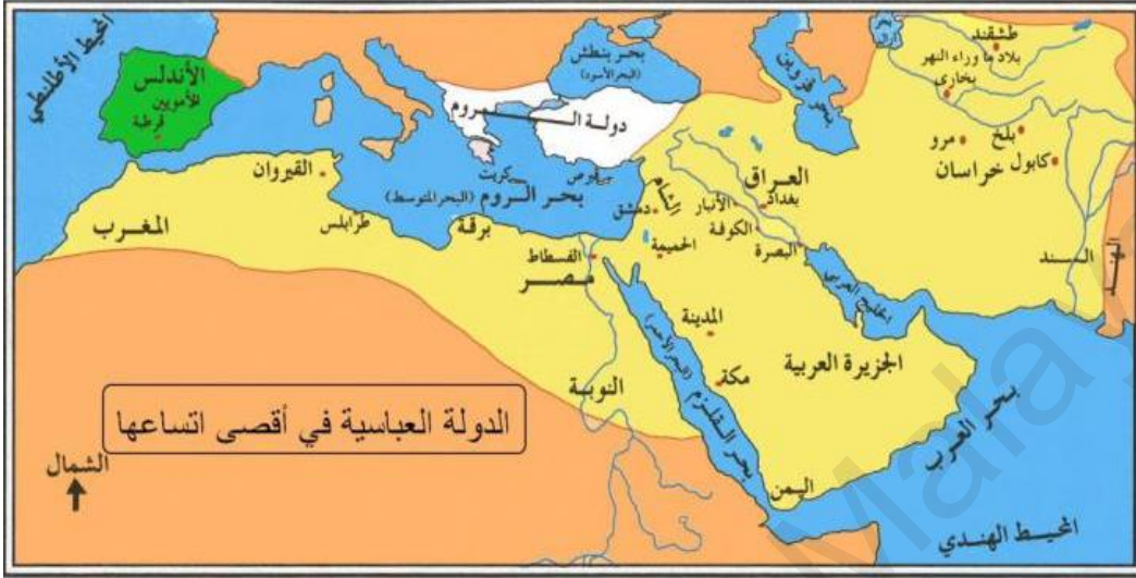
خريطة الدولة العباسية في أقصى اتساعها