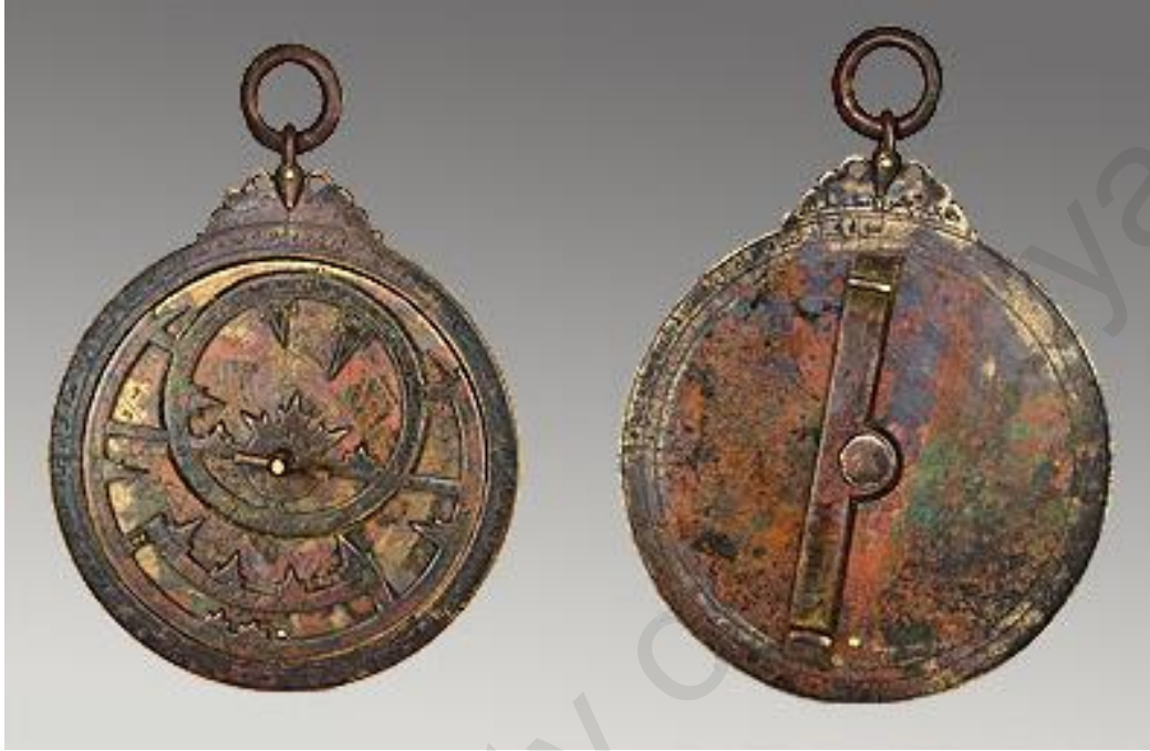
اسطراب اسطواني مسطح صنع في بيت الحكمة ببغداد