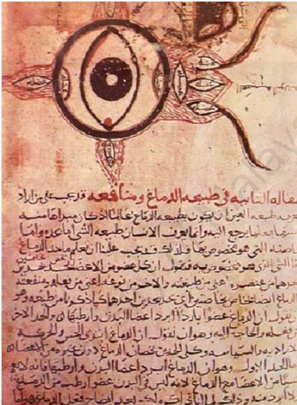
نسخة من مخطوطة توضح تشريح العين لحنين بن إسحاق