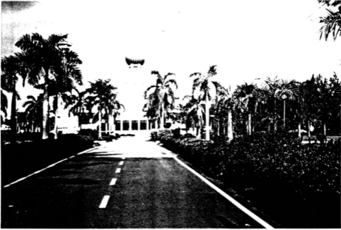
Masjid KUSZA Tersergam Indah di Dalam Kampus