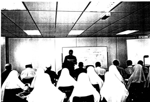
Salah Seorang Pensyarah Sedang Menyampaikan Kuliyyah