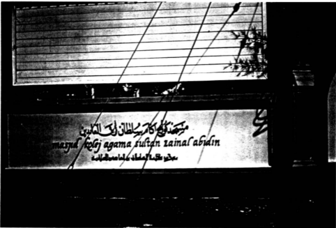
Papan Tanda Masjid KUSZA