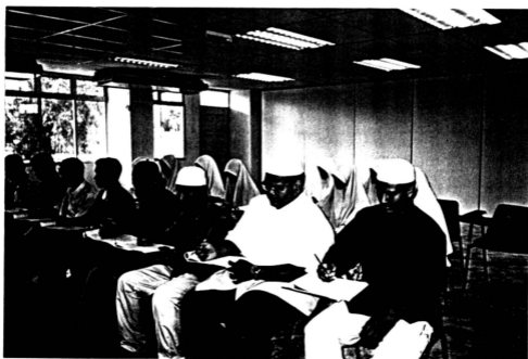
Para Pelajar Mencatatkan Nota-nota Penting