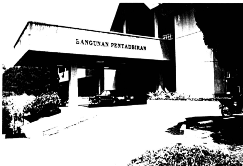
Bangunan Pentadbiran KUSZA