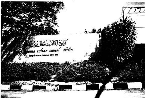
Papan Tanda Kolej Agama Sultan Zainal Abidin