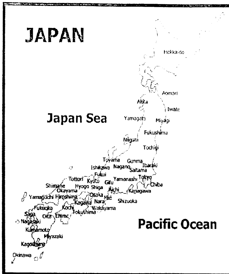
Peta 1.2 Negara Jepun